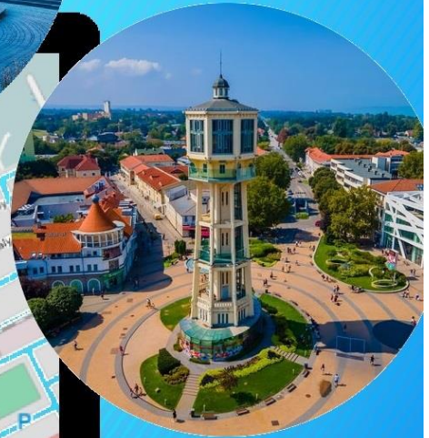
2.állomás Főtér, Víztorony